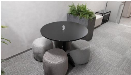
打ち合わせコーナー

また、ちょっとした打ち合わせに利用いただけるフリースペースや、WEB会議やテレワークに活用いただけるリモートブースも無料で利用可能です。利用時間は9時30分～17時00分、空いていれば予約がなくても利用できます。また、事前の予約も可能です。是非、ご活用ください!